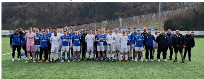
Testspiel gegen Fortuna Ballendorf

Am Samstagmorgen traten wir dann gegen Fortuna Ballendorf an. Beide Teams erhielten jeweils eine Halbzeit Spielzeit: Team 1 erkämpfte sich nach frühem 0:2 Rückstand ein 2:2, während Team 2 sich mit 0:4 geschlagen geben musste. Trotz des Ergebnisses sammelten alle wichtige Spielpraxis.